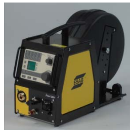
Origo™ Feed 3004/4804